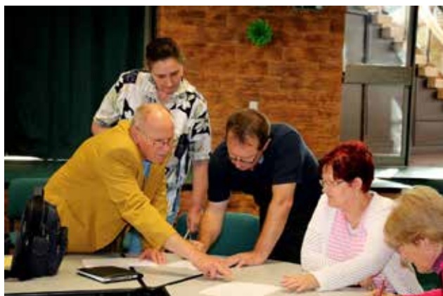
Kazincbarcikai Egyesületek Fóruma

A Kazincbarcikai Egyesületek Fóruma 2 éves előkészítő munka után 1996. december 18.-án alakult meg 18 szervezet összefogásával. Céljaik: A Kazincbarcikán és környékén működő civil szervezetek összefogása, érdekképviselése. Szolgáltatásaival elősegíti a civil társadalom szervezeteinek és közösségeinek megerősödését Kazincbarcikán és térségében. Támogatja a civil szervezetek közös munkáját és közreműködik a szektorok közötti együttműködés fejlesztésében. Kapcsolatot épít és tart fenn regionális, országos és nemzetközi szinten a civil szervezetekkel. Jelenleg 26 szervezet a tagja.