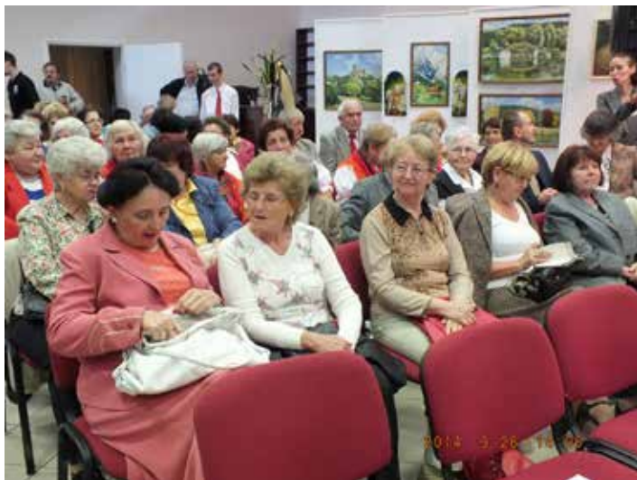
Salgótarjáni Civil Kerekasztal

A szervezetet Salgótarján Megyei Jogú Város civil szervezetei hozták létre választás útján 15 fővel, elnökkel és 2 elnökhelyettessel. A kerekasztal választás három évenként történik, de az évente megrendezett Civil Fórumon a kerekasztal beszámol munkájáról.