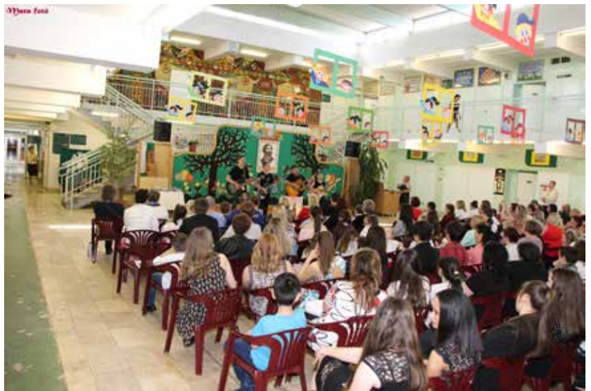
Egressy Béni Nemzetközi Vers-és Prózamondó verseny Kazincbarcika

Havonta 1 alkalommal találkoznak. A Civil klub 18 éves működése alatt egyre fontosabb szerepet tölt be a város közéletében és a civil szektor életében. Egyre inkább megvalósul a szellemi műhely funkciója. Információáramlás - programok egyeztetése - probléma felvetés, megoldások keresése - szektoron belüli és szektorok közötti kooperáció - a civil közösség fejlesztése.