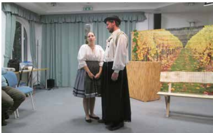
A Mozaik társulat előadása