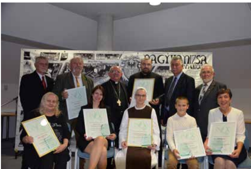
Nagykanizsa Köszönet Napja

A Civil Szervezetek Szövetsége 2012-ben indított egy tagszervezetei számára igénybe vehető szolgáltatást a civil biztosítást. Amennyiben egy civil szervezet munkatársat alkalmaz vagy önkénteseket fogad, és a munkavégzés közben baleset történik, akkor a szervezetet munkáltatói és baleseti kártérítési felelősség terheli. Abban az esetben, ha a civil szervezet szolgáltatásokat nyújt, illetve rendezvényeket szervez a saját székhelyén vagy egyéb külső helyszínen, baleset vagy egyéb káresemény bekövetkeztekor a rendezvény szervezőjeként szintén kártérítési felelősséggel tartozik. Egy ilyen káresemény bekövetkezése jelentős pénzkidrást jelenthet a szervezet számára, de egy olyan biztosítás, amely megfelelő védelmet nyújt szintén jelentős anyagi terheket jelent. Ezt felismerve az egyik biztosító társasággal együttműködve a Szövetség a tagszervezetei számára a fenti problémák megelőzésére megfizethető konstrukciót kínált.