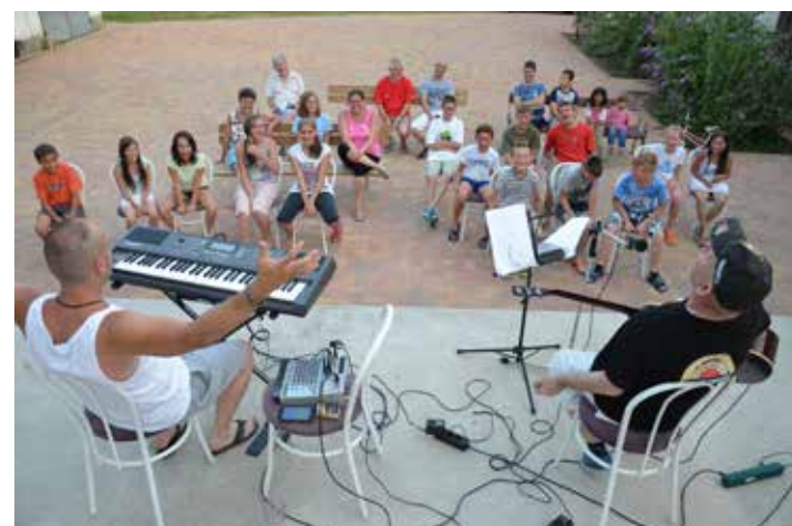
Magyarucca koncert a táborban