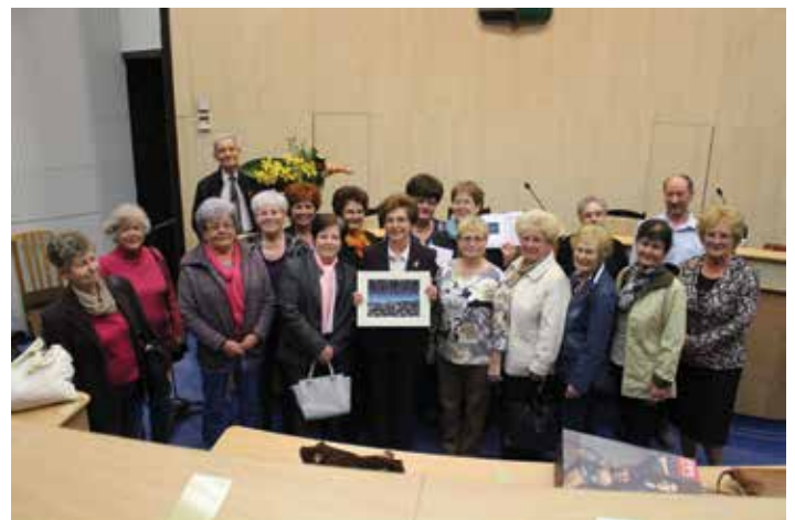
Salgótarjáni Civil Kerekasztal

Kiemelt programjaik között szerepel a „Civilek a városért” - díj alapítása és átadása a salgótarjáni civilek javaslatai alapján. A díjat egy fiatal képzőművész, Birkás Babett készíti el az Alapítvány támogatásával és a Civil Fórumon történik meg átadása.