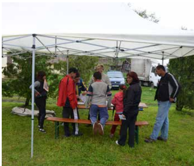
Zalamerenye -egészségügyi állapotfelmérés

Kérjük, amennyiben elképzelése, ötlete van az együttműködés fejlesztésére, ossza meg velünk gondolatait és küldje el azt E-mail címünkre (civilkerekasztal@gmail.com). Együttműködését előre is köszönjük!