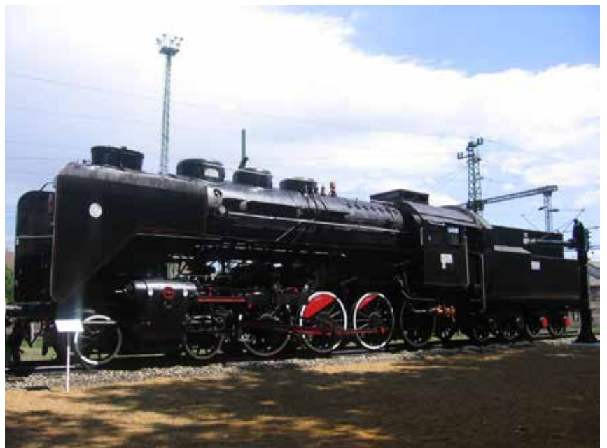
A felújított kanizsai gőzös

Akkreditált Kiváló Tehetség Pontukon a testi kineztetikus és a művészeti területen, Zala megye 4 településén közel 500 főnek nyújtanak tehetségsegítő szolgáltatást. Az Egészség Pont szakemberei egészségnapokat, előadásokat, kiállításokat, foglalkozásokat tartanak, civil véradást szerveznek évi két alkalommal.