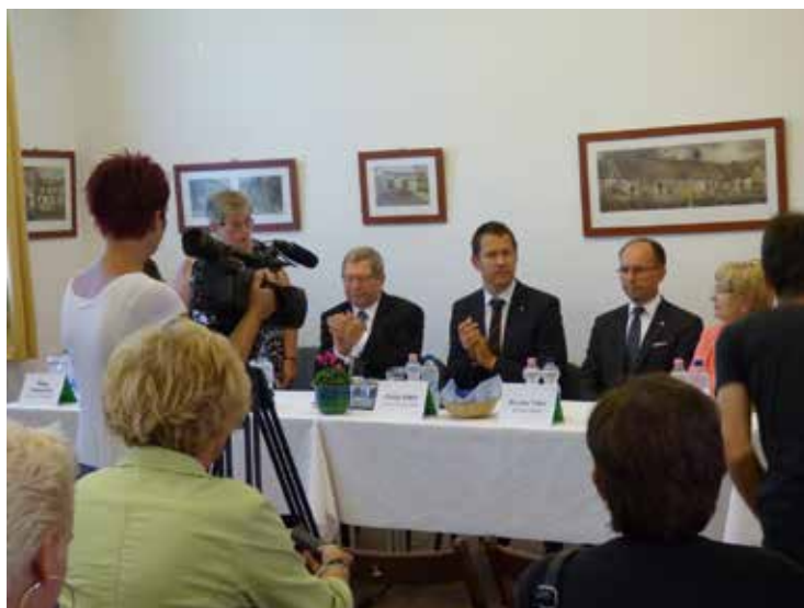
A konferencia megnyitója

A délután szakmai tanácskozással folytatódott a civil kerekasztalok tagjai között, ahol a jó és rossz gyakorlatok megbeszélése volt a legfontosabb pont. Egységes vélemény volt minden résztvevő oldaláról, hogy nagyon fontos a város és a kerekasztalok jó kapcsolata. Ez elég vegyes képet mutat az ország egészére tekintve. Szóba került az is, hogy nagyon kevés a fiatal a civil szervezeteknél, hiszen a sportegyesületeket leszámítva az átlag életkor 68 év. Van olyan szervezet, ahol az elnök nem tud lemondani, mert nincs, aki átvegye a helyét. Így nagyon fontos dolog a fiatalok bevonása a civil életbe és ehhez egy nagyon jó alap a diák közösségi szolgálat teljesítése. Valamint az is, hogy ifjúsági tagozatok alakuljanak, hiszen ez is egy kis alapot ad arra, hogy a későbbiekben ezek a fiatalok vigyék tovább az egyesület munkáját. A vendégek este megtekintették a székesegyház fényfestését és részt vettek a Fő téri rendezvényen.